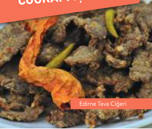
Edirne Tava Ciğeri

Gerçekten yöresinden mi sorusuna cevaptır. Yöresinin kalite işaretidir.