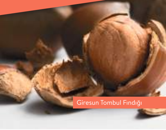
Giresun Tombul Fındığı

Ürünlerinizin piyasada hak ettiği değerde satılmanı sağlar.